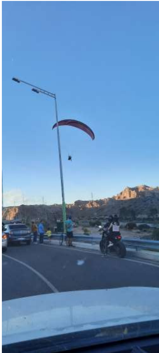
El descenso adyacente a la ruta representa un potencial riesgo, adicional al de impacto con las LAT y la LEAT.