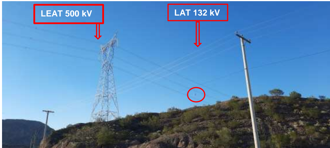
Cruce LAT (132 kV) y LEAT (500 kV). Se observa la importante diferencia de altura