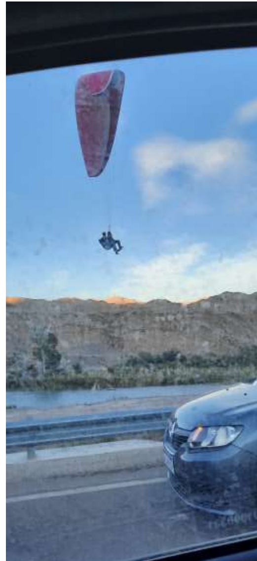
Dos personas en el parapente, cuando el protocolo lo prohíbe, lo que representa un incumplimiento más, a los observados.