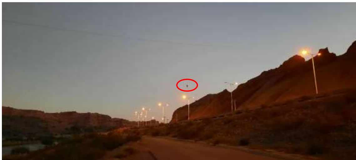
En el relevamiento realizado en la zona, se ha comprobado, como lo demuestra la foto, que es bastante normal la realización de vuelos nocturnos, incrementándose notablemente los riesgos de impacto con las LAT y la LEAT.